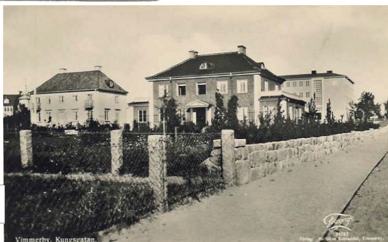
Vy mot skolan