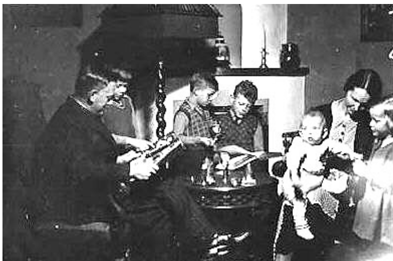
En vanlig lördagskväll. Familjen samlades vid öppna spisen.