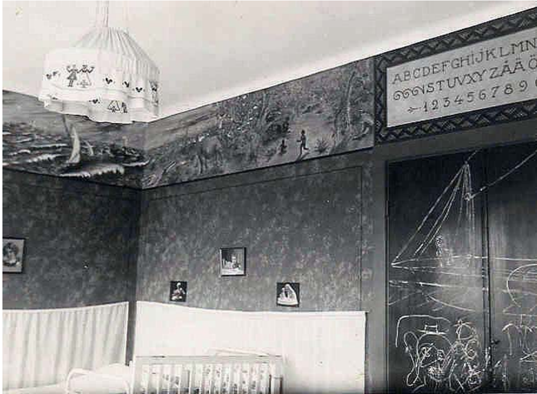
Barnkammaren med sina väggmålningar