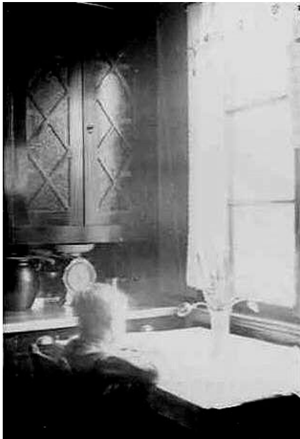
En dålig bild av Jan vid köksbordet men ger en viss bild av inredningen i köket.