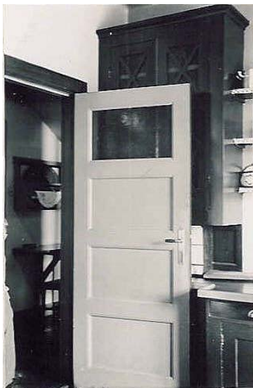
Denna dörr går mellan kök och serveringsrum och man kan också se inred-