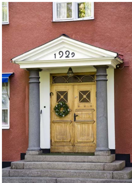
Närbild år 2006 av stora ingången på framsidan med sitt nybyggnadsår