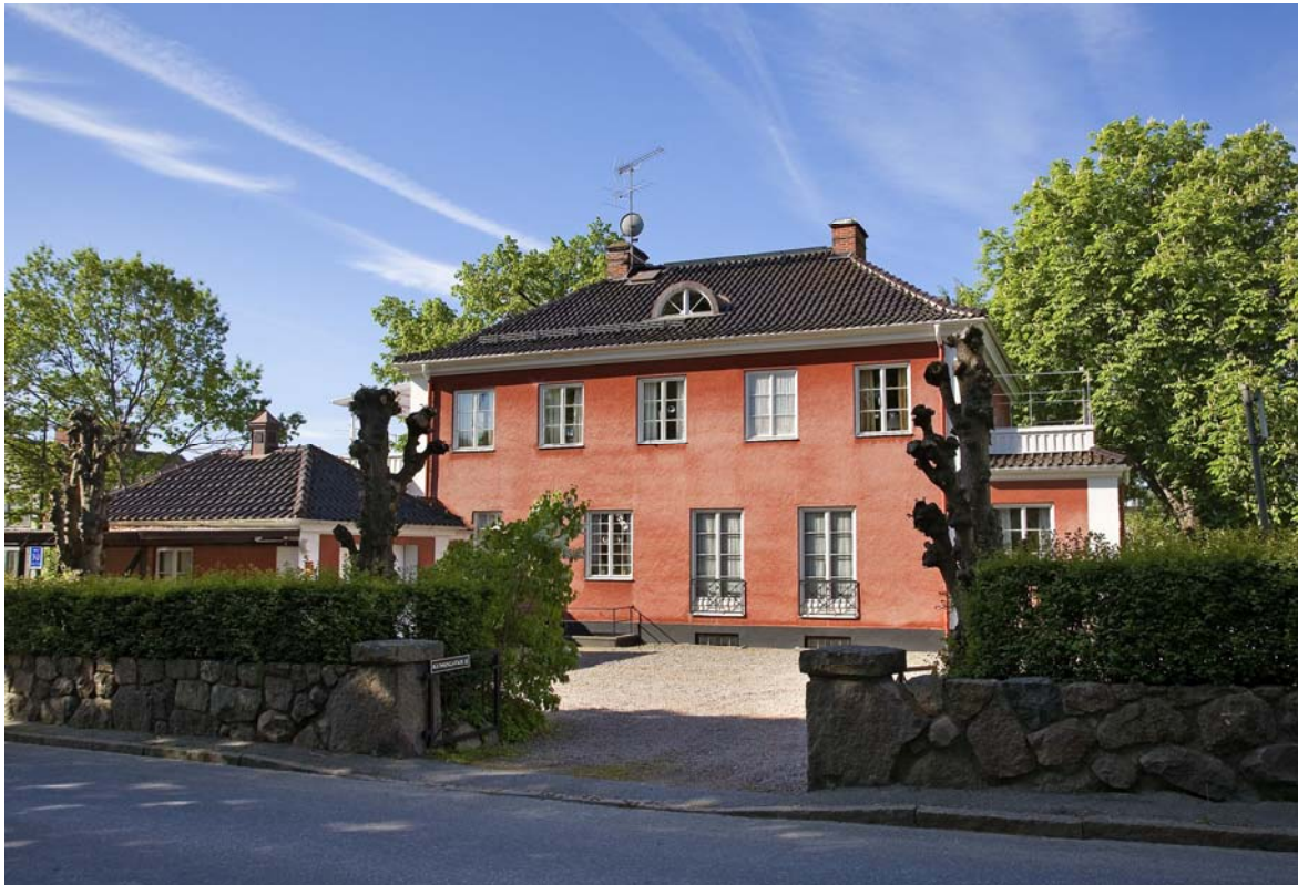
Vy från Astrids Lindgrens skola juni 2006