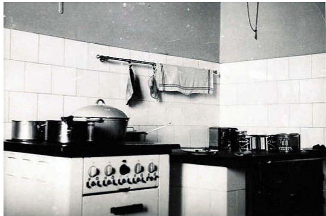
Här har den första el-spisen installerats men för säkerhets skull finns den gamla vedspisen kvar .