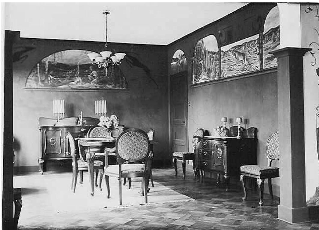
Matsalen med sina väggmålningar